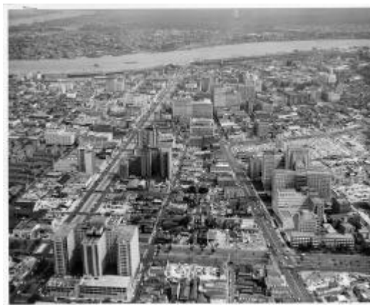
The New Orleans Skyline, 1955