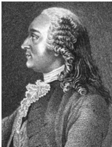
Portrait gravé de Turgot, in Pierre-Samuel Dupont de Nemours (éd.), Œuvres posthumes de M. Turgot , Lausanne, 1787, n. p.