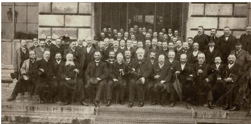
Alexandre Ribot et les anciens élèves du lycée de Saint-Omer (devant l'hôtel de ville, vers 1910)

Paris (13 janvier 2023) - Saint-Omer (10 mars 2023)