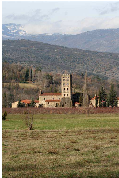
Abbaye Saint-Michel de Cuxà