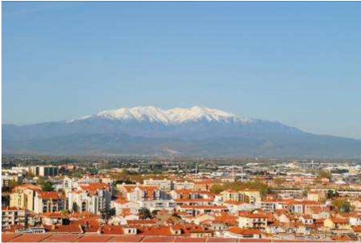
Ville de Perpignan