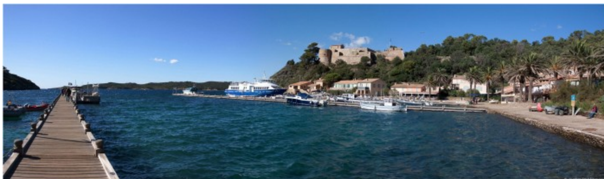
Port de Port Cros

Le cycle de colloques BiodiverCities a pour vocation la mise en commun de démarches, études et expériences en cours, ainsi que des comparaisons entre espaces protégés. BiodiverCities 2015 proposera des regards croisés multiples : France/pays émergents, pays du Nord/pays du Sud, parcs nationaux/autres espaces naturels protégés... en plus de la mise en commun d'expériences entre ces parcs « méditerranéens » que sont les Calanques, Port-Cros et le Cap.