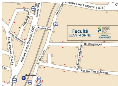
Plan de la Faculté Jean Monnet – Salle Vedel (bâtiment G)

RER B, Station Robinson, descendre l'avenue de la Gare, puis prendre à droite, boulevard Desgranges.