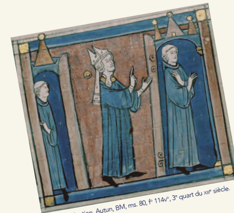
Décret de Gratien, Autun, BM, ms. 80, f° 114v, 3 e quart du xiv e siècle.

10-12 mai 2017 Université Grenoble Alpes