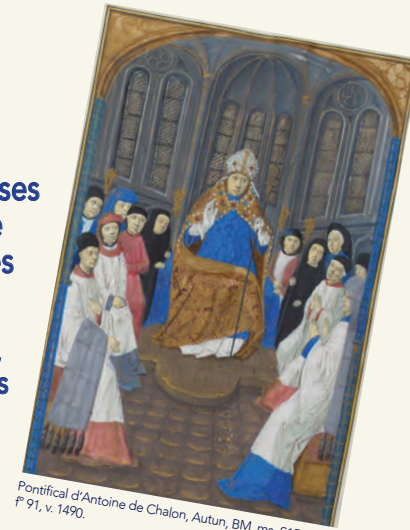
Pontifical d'Antoine de Chalon, Autun, BM, ms. S151(129), f° 91, v. 1490.