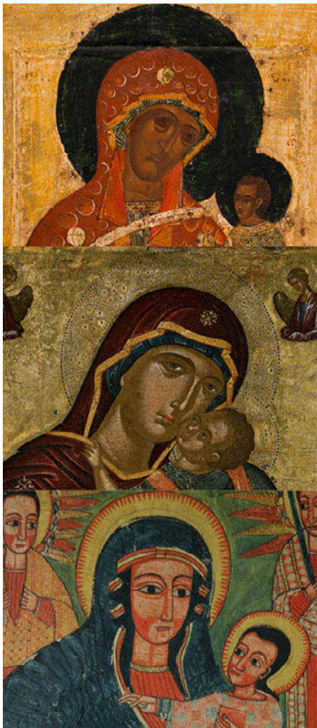
La Mère de Dieu, montagne inviolée ; Novgorod (xvi e s.), Musée des Beaux-Arts de la Ville de Paris, Petit Palais, PPP4902

Institut national d'histoire de l'art – 2, rue Vivienne 75002 Paris (salle Vasari)