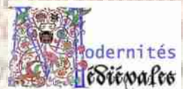
Image de fond : Barthélemy l'Anglais, Le Livre des propriétés des choses , 1480, enluminure d'Evrard d'Espinques, Paris, BnF, département des Manuscrits, Français 9140, fol. 243v.