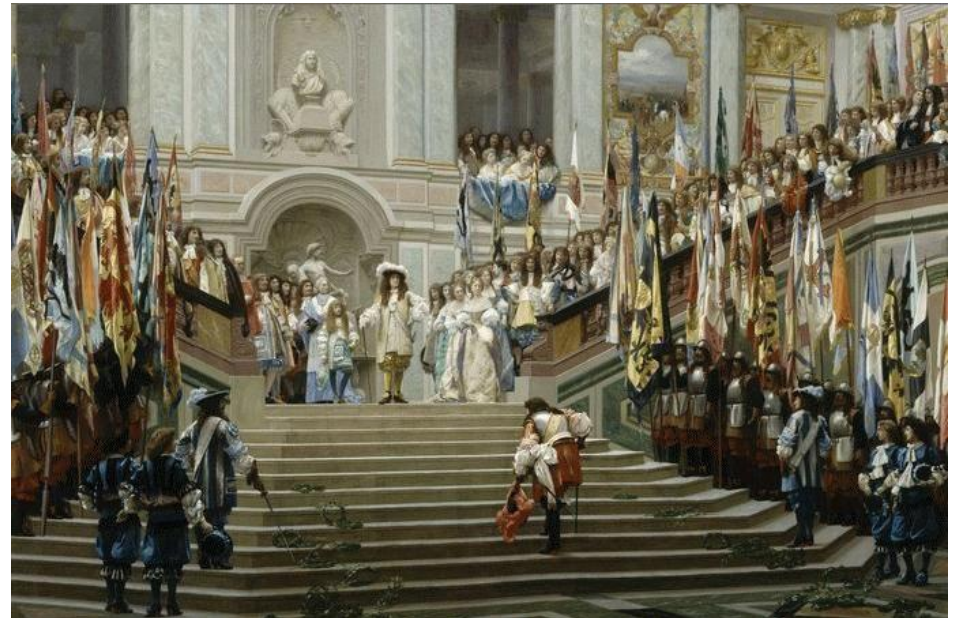
Jean-Léon Gérôme, Réception du Grand Condé par Louis XIV (Versailles, 1674) , 1878.