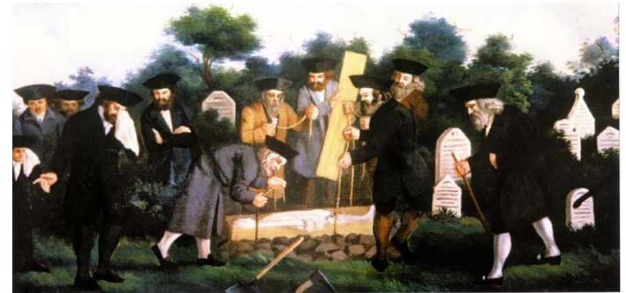
Inhumation dans un cimetière juif. Anonyme (XVIIIe siècle)-musée du judaïsme de Prague