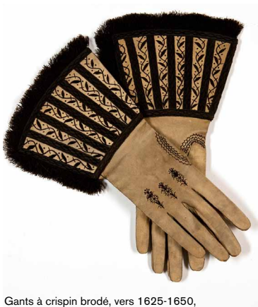
Gants à crispin brodé, vers 1625-1650, Les Arts Décoratifs