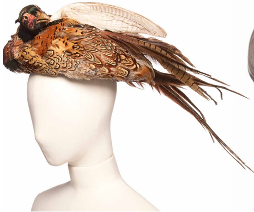
Chapeau, vers 1890-1900, Les Arts Décoratifs