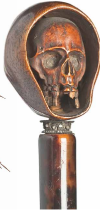
Pommeau d'ombrelle, vers 1880, Les Arts Décoratifs