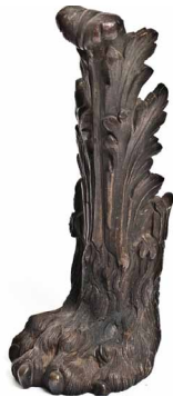
Sabot de meuble, France XVIII e siècle, Les Arts Décoratifs