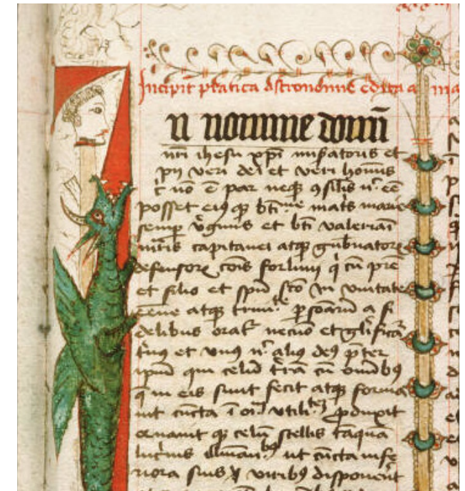
Avignon, Médiathèque Ceccano, ms 1022, f. 33r (fin XIII e siècle)