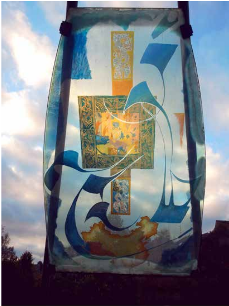
«Oeuvre à la vie» de Louis-Marie CATT Jardin du Nançon - Ville de Fougères (France 35)