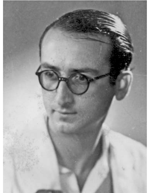
E. Charlot en 1936

Le comité du Centenaire Edmond Charlot et la Bibliothèque nationale de France s'associent pour lui rendre hommage à l'occasion du centième anniversaire de sa naissance, inscrit au rang des commémorations nationales de l'année 2015.