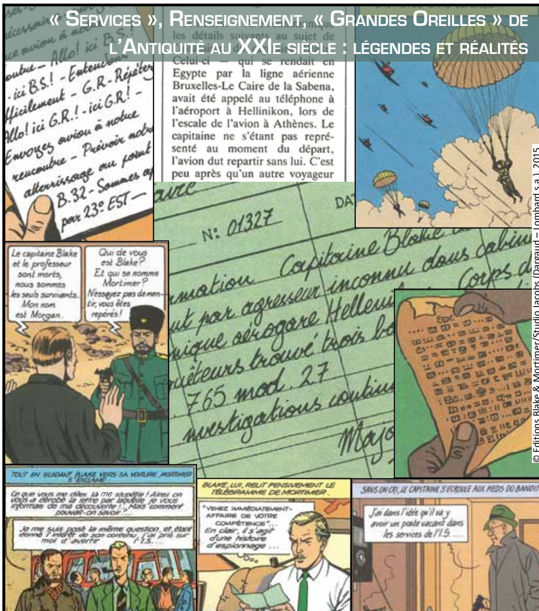
© Editions Blake & Mortimer/Studio Jacobs (Dargaud - Lombard s.a.), 2015

Château de La Roche-Guyon 1, rue de l'Audience 95780 La Roche-Guyon 01 34 79 74 42 www.chateaudelarocheGuyon.fr