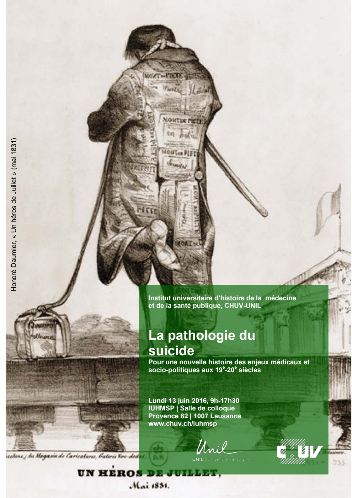
Honoré Daumier, « Un héros de Juillet » (mai 1831)

Institut universitaire d'histoire de la médecine et de la santé publique, CHUV-UNIL