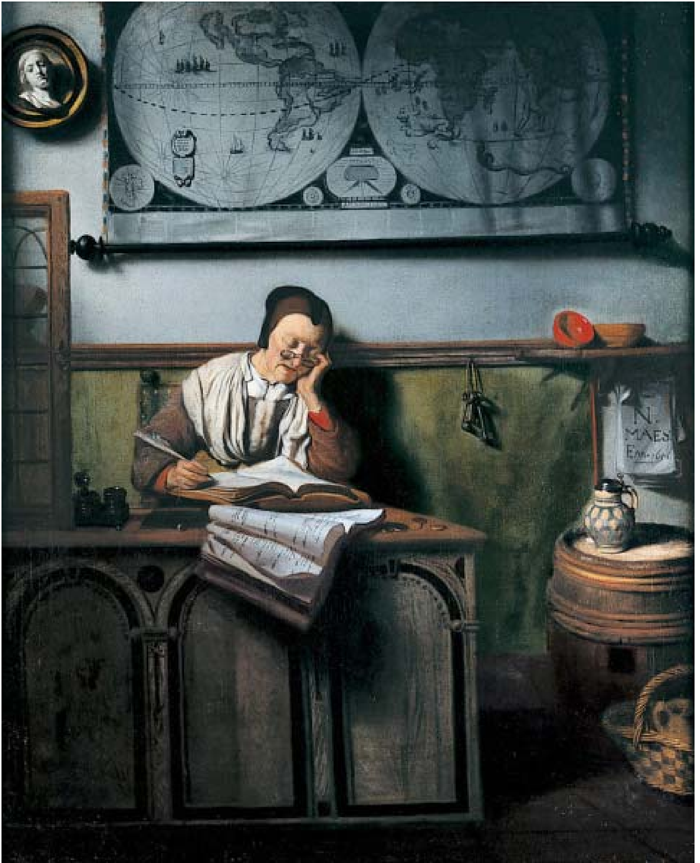
Nicolaes Maes (1634-1693): The Account Keeper, 1656, Öl auf Lw., 66 x 53,7 cm, Saint Louis Art Museum