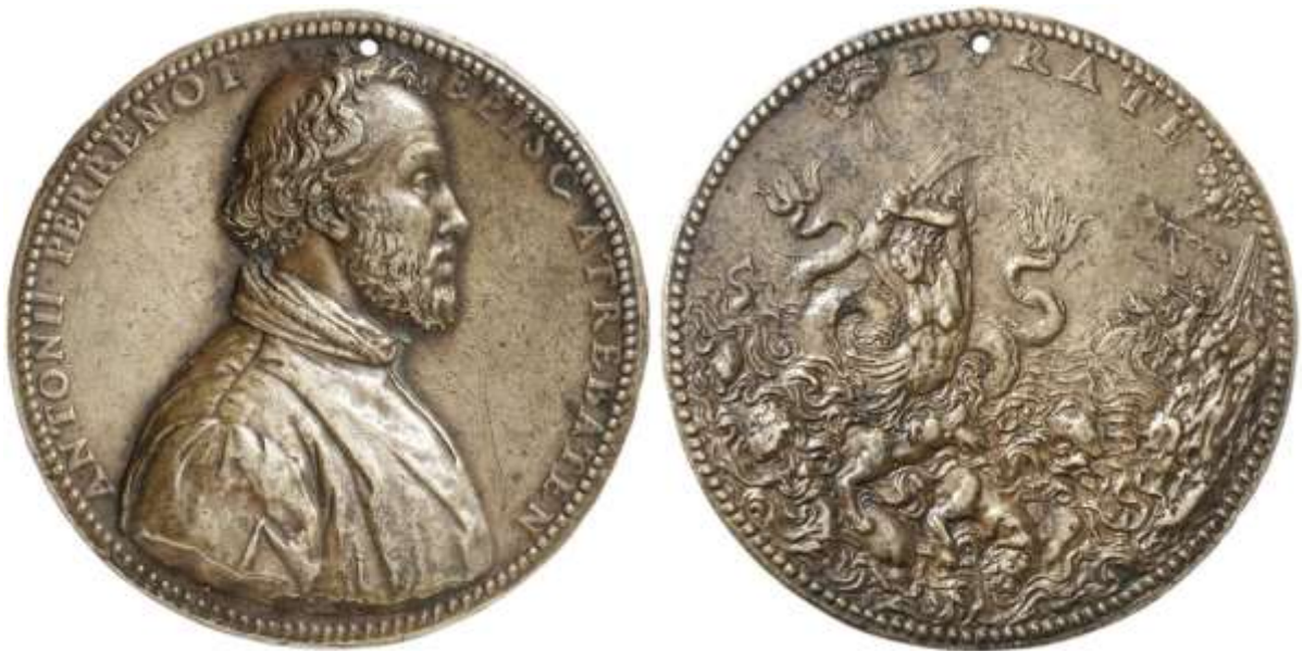
Attribué à J. Jonghelinck, Médaille d'Antoine Perrenot de Granvelle, évêque d'Arras, coll. part.