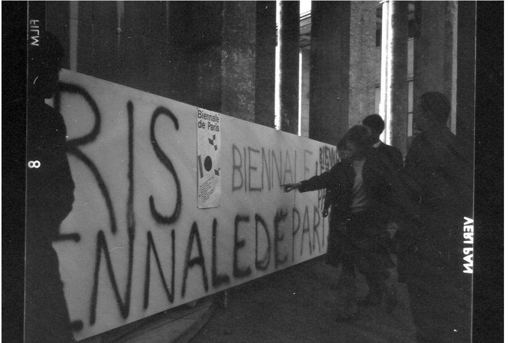
Robert César, Biennale de Paris, 1965, vue d'extérieur.