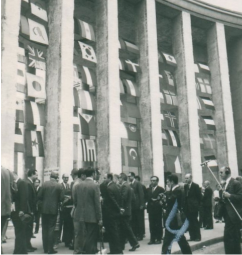
Samy Poliathek, inauguration de la 5 e Biennale de Paris, 1967

24 octobre 2017 INHA, salle Giorgio Vasari, 17H - 20H